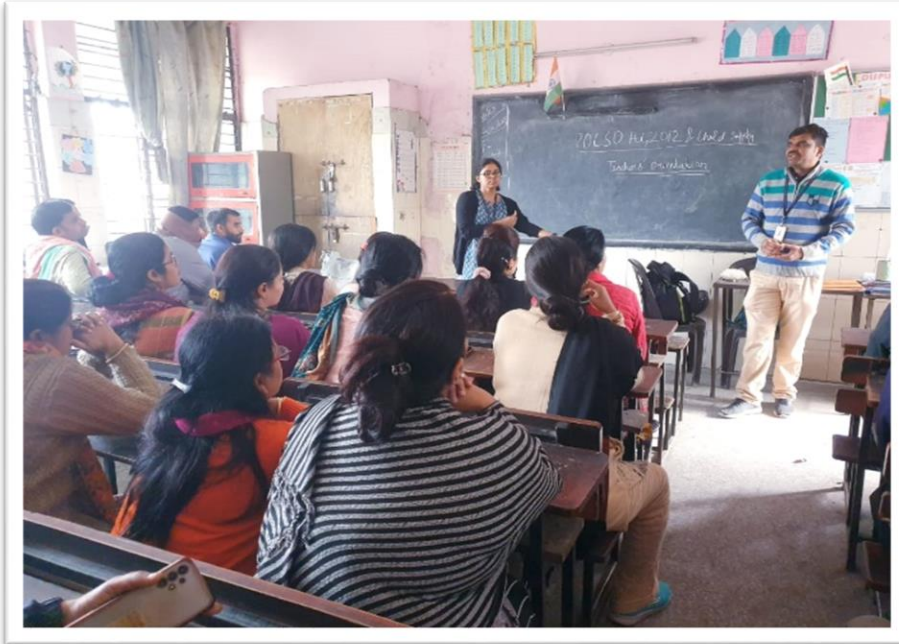
AOC Trainers Conducting Teachers' Orientation at MCD Jaitpur