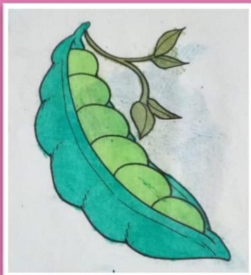
Artwork by Students