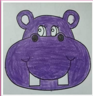
Artwork by Students