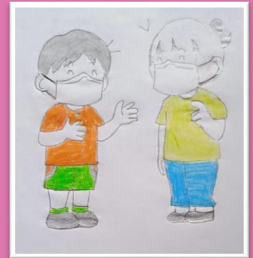
Artwork by the Students