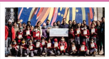
MCF team and Khwabgah students with Mr Modi