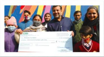
Mr Modi making a generous donation to the Khwabgah program